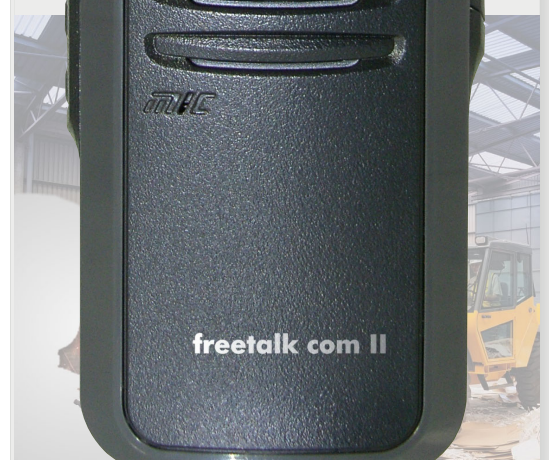
Abb. ca. Originalgröße

Bedienungsanleitung stabo freetalk com II 16 Kanal