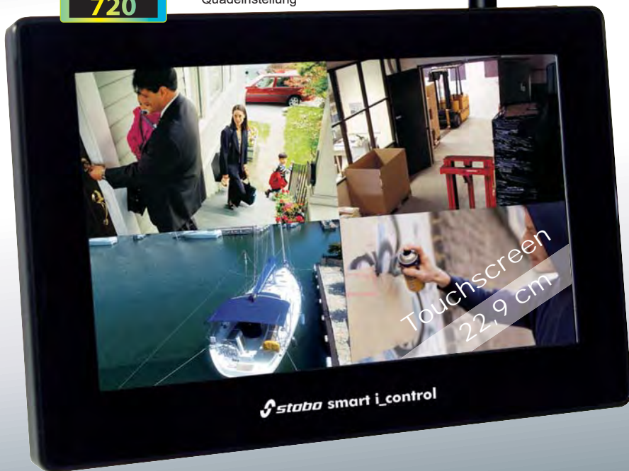
Abbildung zeigt Monitor in Quadeinstellung**

22,9 cm (9") LCD-Touchscreen (1024 x 600 HD)