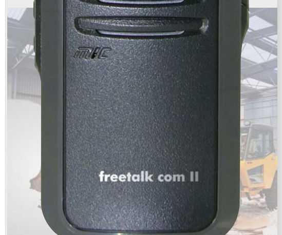
Abb. ca. Originalgröße

Bedienungsanleitung stabo freetalk com II 16 Kanal